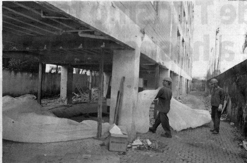
Oito funcionários da empresa DCI começaram ontem os preparativos para a destruição do edifício

A Prefeitura informou que, no dia da demolição, será realizada uma mobilização conjunta, envolvendo a Defesa Civil, Corpo de Bombeiros, Polícia Militar, Translitoral, Guarda Municipal, Elektro, Detran e as secretarias do Município para que tudo ocorra de forma tranquila. A previsão é que a Defesa